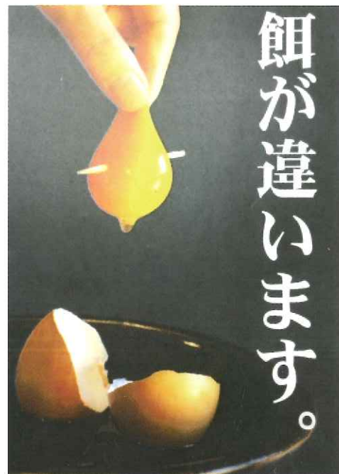
有限会社カンナンファームポスター