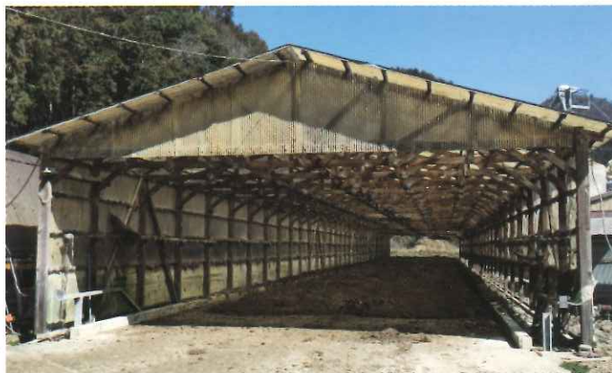
写真 2 : 乾燥ハウス