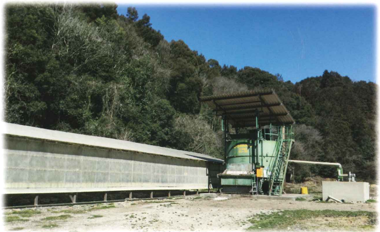
有限会社カンナンファーム 乾燥ハウスと縦型密閉コンポ式発酵機 (コンポ富士SK-35型)