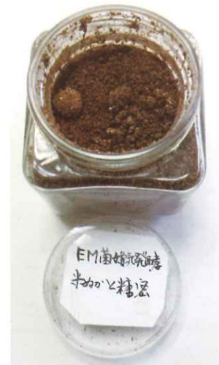
写真 1 : EM菌

鶏舎から 1～4 日以内の頻度で鶏糞搬出 ↓ 乾燥ハウスで一次発酵 ↓ 約 3 週間 縦型密閉コンボ式発酵機で発酵 EM菌と米ぬかを発酵させたもの (写真 1) を 定期的に投入 ↓ 約 2 週間 完成・袋詰め