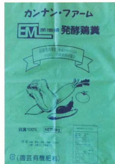
写真 3 : 堆肥袋 (15kg)