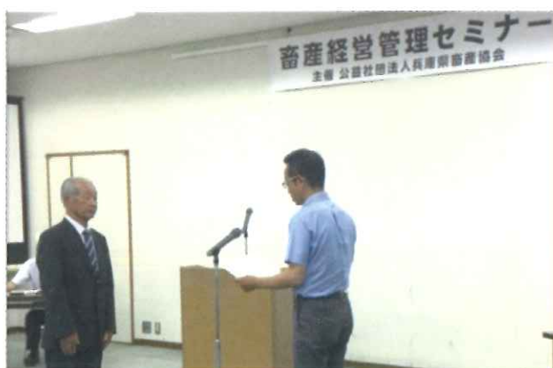
写真4 堆肥共励会表彰式 (平成29年9月22日)

成分評価、官能評価とも最も点数が高く、水分、C/N 比も適正に調整された良質な堆きゅう肥でした。この農場では独自の自家配合飼料を用いる等、卵の生産過程にこだわった経営が展開されており、堆きゅう肥の販売も有機農業を実施している耕種農家に袋詰めを主体として流通されています。採卵鶏農場として規模は小さいながらも、製品づくりに独自のこだわりを持ち、それを強みとして堆きゅう肥も有利に販売する方法は、県内の他農場にも大いに参考になるものと考えられました。